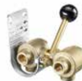
IT Valvola a tre vie per selezione del serbatoio interno o esterno EN Three-way valve for selecting the in-built or external fuel tank FR Vanne à trois voies pour sélectionner le réservoir intégré ou externe