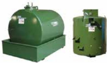
IT Cisterna esterna EN External fuel tank FR Réservoir de carburant