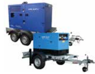
IT Carrelli di traino lento o stradale omologato per la circolazione negli stati membri UE EN Non-road or road trailers approved for circulation in the EU member states FR Remorques non routières ou routières autorisées à circuler dans les états membres de l'UE