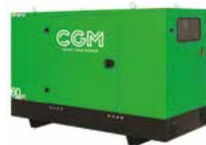
IT Colori opzionali EN Optional colors FR Couleurs optionnelles