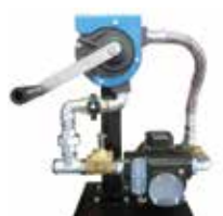
IT Kit rabbocco automatico carburante EN Automatic refueling kit FR Kit de ravitaillement automatique du carburant