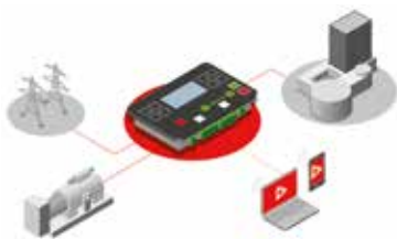
IT Controllo remoto via ethernet, rete 2G-4G e controllo posizione GPS EN Remote control via ethernet, 2G-4G network and GPS position control FR Commande à distance via Ethernet, connexion 2G-4G, et contrôle de position GPS