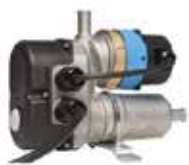
IT Preriscaldamento motore EN Engine pre-heating system FR Système de préchauffage du moteur