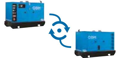
IT Quadri di alternanza o di parallelo più gruppi elettrogeni EN Alternation or synchronizing panels FR Panneaux de synchronisation ou alternance