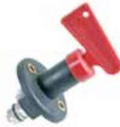
IT Staccabatteria EN Battery switch FR Commutateur de batterie