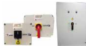
IT Quadro di commutazione manuale MTS EN Manual Transfer Switch FR Inverseur manuel