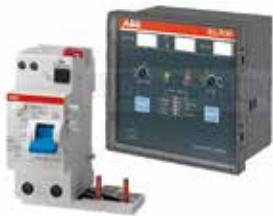
IT Protezione differenziale EN Residual current protection FR Protection différentiel à courant résiduel