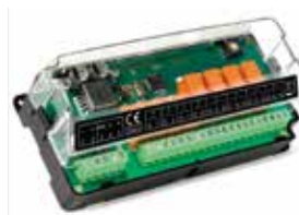
IT Modulo di espansione allarmi per centralina EN Control board alarms expansion module FR Module d'extension des alarmes pour la carte de contrôle