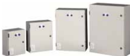
IT Quadro di commutazione automatica ATS EN Automatic Transfer Switch FR Inverseur automatique