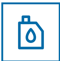
IT Serbatoio maggiorato EN Oversized fuel tank FR Réservoir surdimensionné